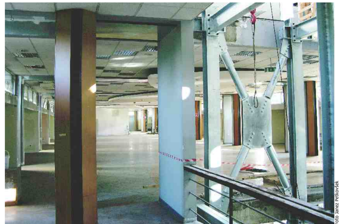
DEL NOTRANJOSTI BODOČE ASTRÉ – Veleblagovnico Astra ob Dunajski cesti, ki je bila včasih eden pomembnejših trgovskih centrov za Bežigradom, v zadnjih dveh letih pa je bolj ali manj prazna, lahko črtamo s seznama ljubljanskih sramot. V pritličju so uredili prostore za plesno šolo Bolero, prenova 4800 kvadratnih metrov neto površine od druge kleti do drugega nadstropja (na fotografiji je viden del novega osrednjega stopnišča z dvigali) pa bo končana še pred koncem leta. Z razsvetljavo bodo ponoči poudarili Severjevo arhitekturo. Ta bo močnejša ob Dunajski cesti, ob Einspielerjevi pa bo zastrta zaradi bližine stanovanjskega bloka. Objekt bo razsvetljen le deli noči, tako da ne bo moteč za sosedje. V njem bo predvidoma delovalo od 10 do 15 najemnikov ali kupcev (prostore jim bodo dokončali po želji), najemnina pa bo znašala od pet evrov v kleti do 20 v pritličju.