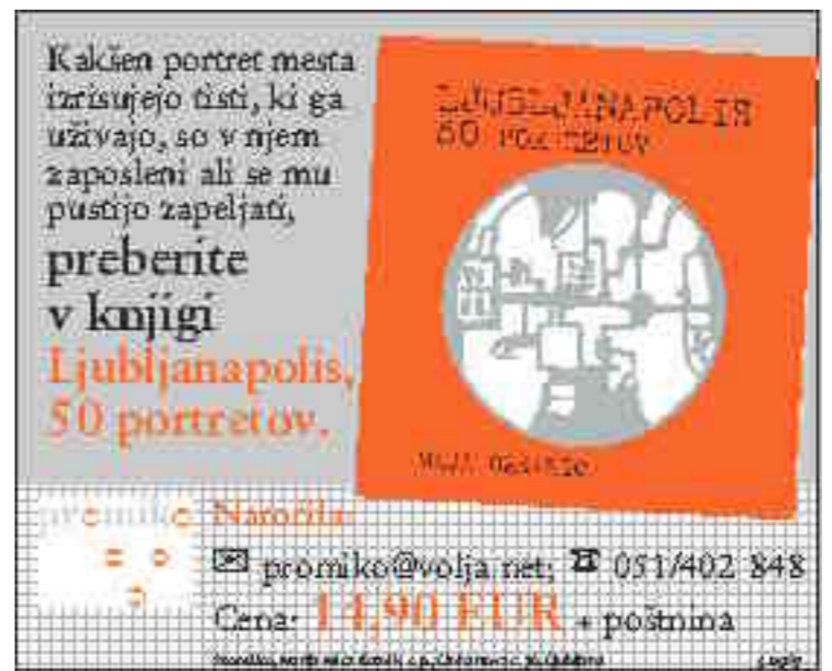
Kakšen portret mesta izrisujejo tisti, ki ga uživajo, so v njem zaposleni ali se mu pustijo zapeljati, preberite v knjigi Ljubljanaopolis, 50 portretov . Narocila: promiko@volja.net, 051/402 848 Cena: 11,90 EUR + poštnina